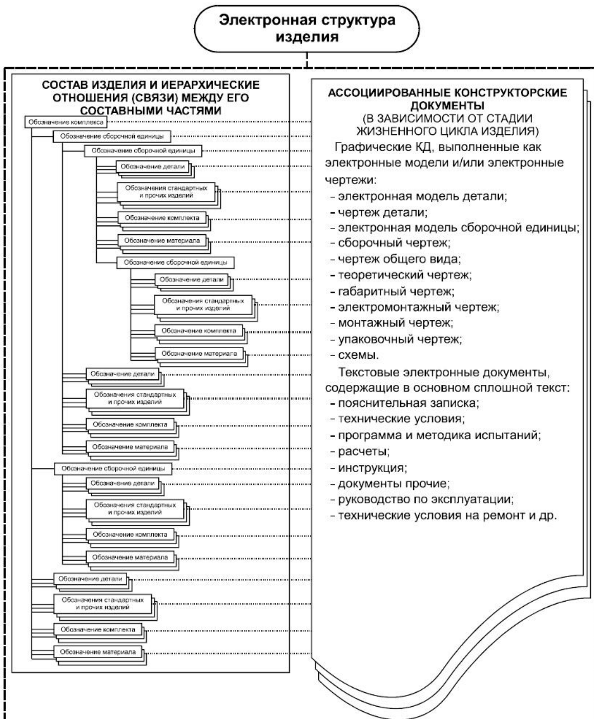
Приложение Б (справочное)